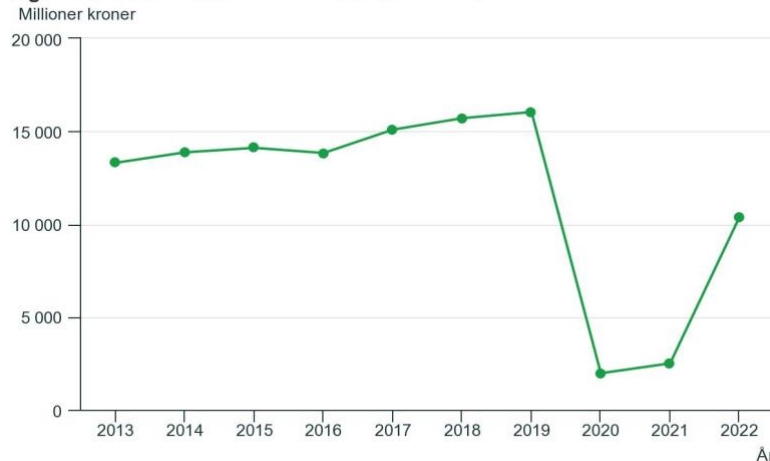
Obr. 2: Miera cezhraničného obchodu v miliónoch (2013-2022) Zdroj: SSB

Nórski výrobcovia a supermarkety sa obávajú vplyvu opätovného spustenia cezhraničných nákupov, pretože ich predaj sa počas pandémie výrazne zvýšil. Podľa Konfederácie nórskych podnikov (NHO) bol na začiatku roku 2000 cezhraničný obchod doplnkom pre nórskych spotrebiteľov, no dnes je hlavným konkurentom nórskemu potravinárskemu a nápojovému priemyslu. Okrem toho NHO poukazuje na záväzky v súčasnej politickej platforme a kritizuje vládu za to, že nerobí dost opatrení pre zníženie cezhraničného obchodu. 2