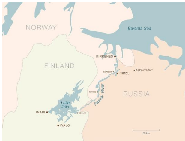
Rieka Pasvik, najsevernejšie pohraničie Fínska, Nórska a Ruska. Mapa: Mapka: The Barents Observer

Ak by sa mali splniť sny Kirkenesu, musela by sa cez Laponsko vybudovať železničná trať. To vyvoláva odpor laponských chovateľov sobov a ochrancov životného prostredia. Zrazu sme d'aleko od niekoľkých sobov, ktorí prekračujú hranicu, ktorú nepoznajú.