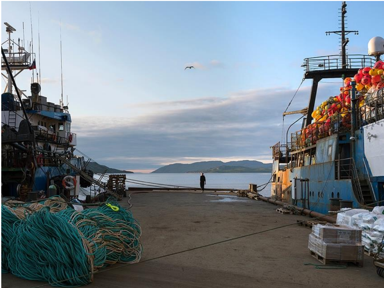
Ruské vlečné lode na lov krabov zakotvené v prístave Kirkenes v Nórsku.