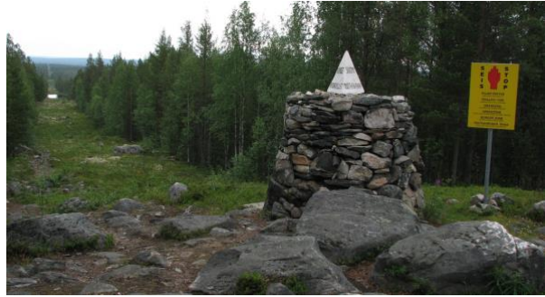
Норвезький прикордонний кам'яний курган

- студентської профспілки сільськогосподарського коледжу в Есі, і борються за свою ідею з моменту свого заснування в 1903 році. Під час канікул, вони постійно збираються разом: прагнучи повернути "свою землю", вони поступово (по одному каменю) за раз переміщують на схід прикордонний кам'яний курган – показник проходження лінії державного кордону.