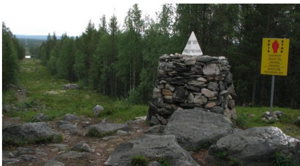
Kamenná mohyla na nórskej hranici

Títo študenti patria do „Trønders Union“ (TF), študentského zväzu na poľnohospodárskej vysokej škole v Ås, a za svoj cieľ bojujú od založenia zväzu v roku 1903. Počas prázdnin sa schádzajú, aby po jednom kameni posunuli hraničnú kamennú mohylu smerom na východ v snahe získať späť „svoju zem“.