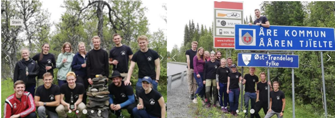
Snímky z aktuálnej webovej stránky TF, na ktorých sú zobrazené nedávne zhromaždenia na hranici medzi Trøndelagom a Jämtlandom.

Obrázky na aktuálnej webovej stránke študentského zväzu prezrádzajú, že sa títo študenti stále stretávajú na trøndelagsko-švédskej hranici, ale zachovávajú určitú mieru diskretnosti, pokiaľ ide o diskusiu o konkrétnych aktivitách. V e-mailovej odpovedi pre Åpenhet z 28. apríla 2023 anonymný zástupca TF objasnil, že informácie týkajúce sa ich hraničného projektu sú dôverné. Dá sa predpokladať, že sa stále snažia dosiahnuť ciele uvedené v stanovách zväzu. Ich základná motivácia na znovuzískanie Jämtlandu, okrem túžby „vziať si späť, čo bolo kedysi naše“, však zostáva nejasná, hoci v pozadí ich konania je jasný zmysel pre humor.